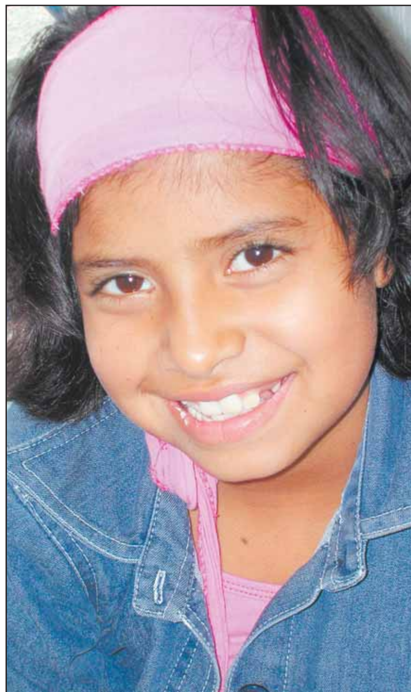
Un sourire angélique malgré une vie extrêmement difficile. LE NOUVELLISTE